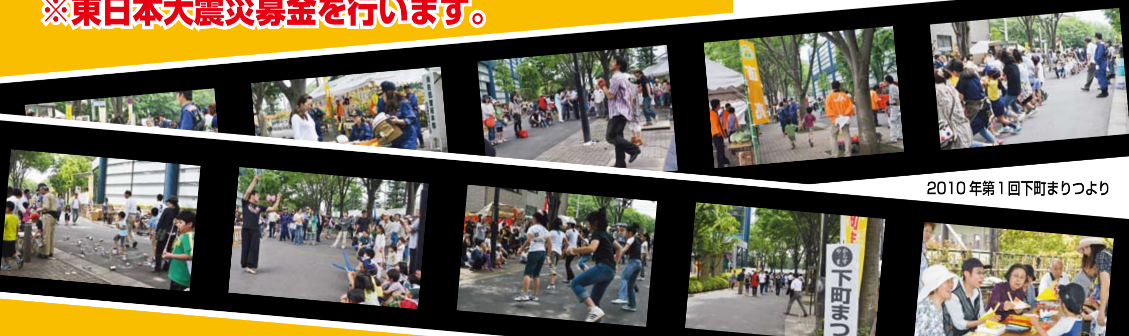
2010年第1回下町まつり

駐車場はございません。 駐輪場が少ないので、できるだけ 徒歩で、お出かけください。